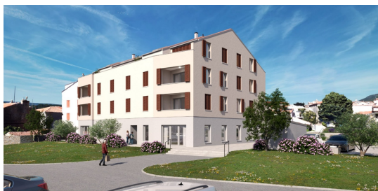
TLOCRT STANA 2.2.

ISTRIA ADRIA Pot za Brdom 102, 1000 Ljubljana e-mail: info@istria-adria.com web: istria-adria.com info: +386 59 200 071